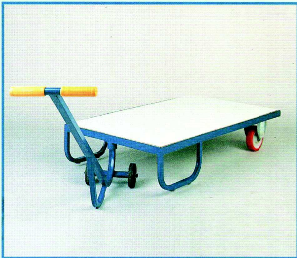
Cod. 285 PEDANA PORTA PEZZE cm 150x150 Cod. 322 PEDANA PORTA PEZZE cm 200x150 Piano in bilaminato, ruote Ø 150 in poliuretano portata 500 Kg