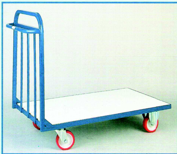
CARRELLO PORTALAVORO CON SPONDA Portata Kg. 250 con ruote in poliuretano Ø 150 Cod. 340 cm 150x100x90h Cod. 278 cm 120x80x90h