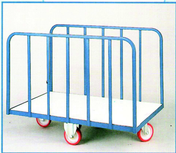
CARRELLO PORTA PEZZE A 2 SPONDE Portata Kg. 400, ruote Ø 150 in poliuretano Cod. 338 cm 150x100x120h Cod. 372 cm 200x100x120h