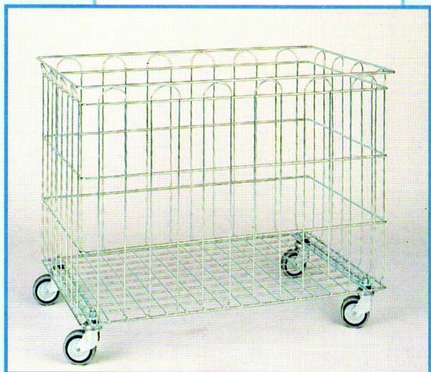
CARRELLO IN FILO ZINCATO cm 86x56x68h con ruote Ø 80 portata Kg 150 Cod. 165